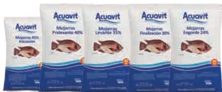
Tabla de alimentación

El alimento a suministrar por día depende del peso promedio de los animales y la temperatura del agua; se calcula como un porcentaje del peso total de los animales cultivados (biomasa).